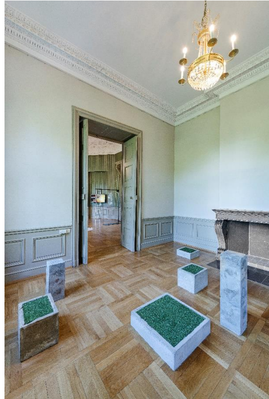
Ausstellungansichten „Garten Arbeiten“, 2021